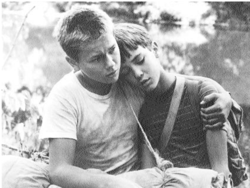
Chris och Gordie, River Phoenix och Wil Wheaton, i Rob Reiners "Stand by me".

Deras planering är bristfällig, och ingen av dem har tänkt på att ta med sig mat. Lite pengar har de däremot.