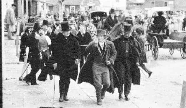
Stellan Skarsgård, Matthew McConaughey & Morgan Freeman på väg till rättegång i Spielbergs "Amistad".

tid – hade Joadson befunnit sig i landets södra del hade han betraktats som ett arbetsdjur istället för en fri man.