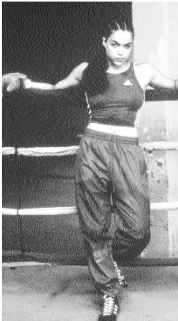
Diana hämtar mycket av sin självkänsla i ringen.