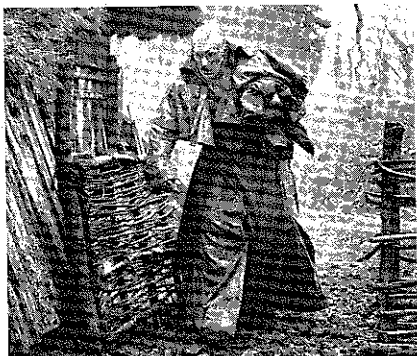
De Niro som "Varelsen", en grotesk och intelligent människa.

B erättelsen om den besatte vetenskapsmannen som släpper lös okontrollerbara och destruktiva krafter är en av vår tids stora myter, vars otaliga variationer alla ytterst går tillbaka till Mary Shelleys roman om Frankenstein. Kenneth Branaghs filmatisering lyfter fram de centrala idéerna i romanen och ger ett rikt stoff för diskussioner, som berör en lång rad skolämnen från filosofi till naturkunskap.