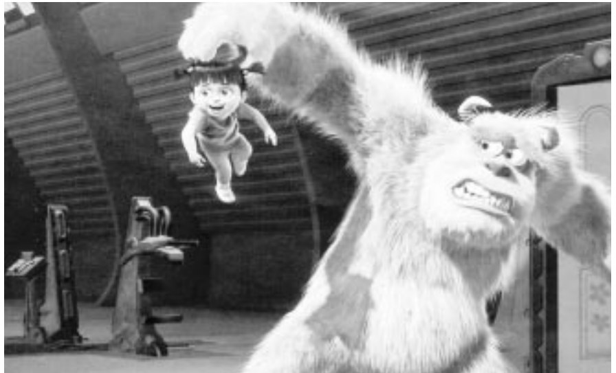
Det började inte så bra, Sulley tror att lilla Bu har baciller.

En dag händer det som absolut inte får hända. Av misstag lyckas en kavat liten flicka smita ut genom den magiska dörren och in i Monsters Inc. Monstren lever nämligen i tron att människobarn är livsfarliga och sprider dödlig smitta. Panik utbryter således bland monstermedborgarna när nyheten om den lilla flickan klabas ut av nyhetsmedierna. En intensiv jakt sätts igång – flickan måste hittas till varje pris. Naturligtvis är det Sulley och Mike som råkar få henne på halsen. Till en början är de vettskrämda, men efter ett tag inser de att hon inte alls är farlig och inriktar sig på att försöka återföra henne till människovärlden. Det är i synnerhet Sulley som huser varma känslor och tar sig an Bu, som han döper henne till. Bu däremot är inte det minsta rädd för monstren och tror