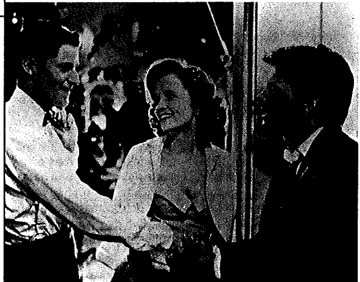
Crispin Glover, Lea Thompson, Michael J Fox