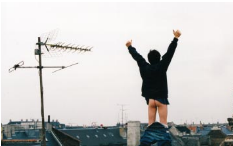
Dennis P skriker ut för Gud och hela världen vad som hänt! Och den som ser filmen vet vad.

Dennis P har många problem – stora som små. I skolan härskar den fruktade läraren Sandström, som visar sadistiska tendenser i klass med Caligula i Alf Sjöbergs klassiska film Hets . Hemma har Dennis P sin mamma som löper