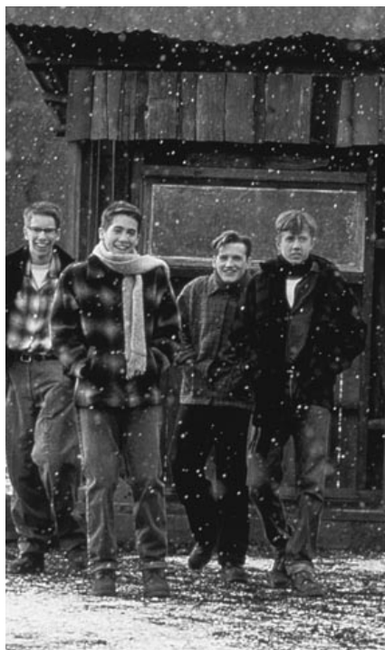
The Rocket Boys vid "Cape Coalwood".

★ Situationen i dagens Sverige är givetvis en helt annan, men finns det viktiga beröringspunkter? Här är det t ex inte på samma sätt en ekonomisk fråga om man vill studera vidare efter gymnasiet, men visst kan man känna trycket av förväntningar hemifrån angående ens framtid? Vilka (sociala) hinder finns det idag i vägen för att förverkliga ens drömmar? Är man beredd att eventuellt offra sin trygghet för att följa sina drömmar? Vad krävs för att man ska vara det?