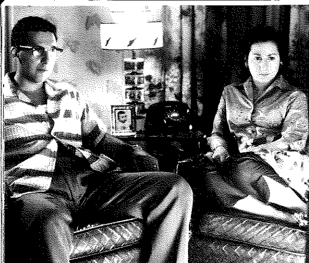
Till vänster förloraren som fortsättningsvis tvingas se "Twenty-One" på TV och till höger den nye vinnaren. I rollerna John Turturro respektive Ralph Fiennes.