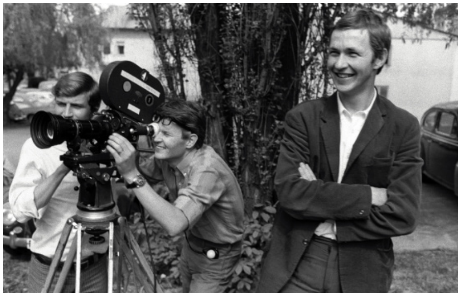
Roy Andersson under inspelningen av En kärlekshistoria .

sommaren 1969 och fick premiär i april 1970. Filmen rymmer flera tidsty-piska teman, såsom de ungas oförstå-else inför vuxenvärlden som framställs som tråkig, stagnerad och närmast förtryckande.