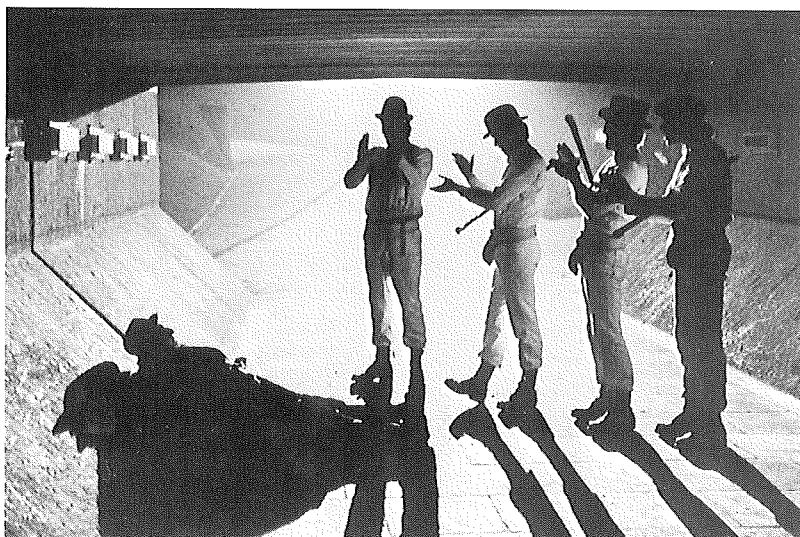
En klassisk bild av gängmisshandel ur "Clockwork Orange", starkt omdebatterad på sin tid.

Det första offret vi möter i filmen är en gammal alkoholiserad uteliggare som man brutalt misshandlar. Efter att senare ha drabbat samman med ett konkurrerande gäng "droogies" beger sig Alex och hans vänner ut på landsbygden där de finner en ödslig lyxvilla. Genom att säga att det har skett en förskräcklig olycka