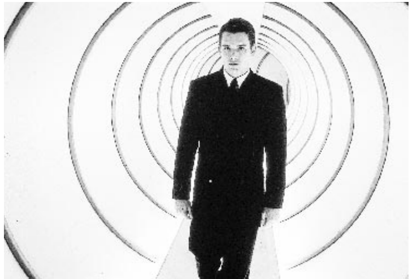
Ethan Hawke i rollen som Vincent, astronaut och elitmänniska på Gattaca men född som "guds barn" det vill säga icke genmanipulerad.

När Vincent ska få ett syskon tar mamma och pappa Freeman det säkra före det osäkra och går till graviditetsläkaren. Där råder fullkomlig frihet i val av barnets kön, hudfärg, hårfärg och egenskaper. Läkaren förutsätter att föräldrarna