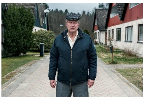
En man som heter Ove.

”Film är soft, från aktivt kikande på dokumentärer, verklighetsflykt med sci fi/äventyr och kikande skratt till nördiga komedier. Gillar koreanska rullar mkt, de är udda och saknar det sedvanliga amerikanska pang-pangande och biljakter även om det kan vara underhållande ibland. Oldboy är en fett bra rulle. Och The yellow sea ffs! Film är allt från solotittande till gemenskap på en regnig lördag med guzzen.”