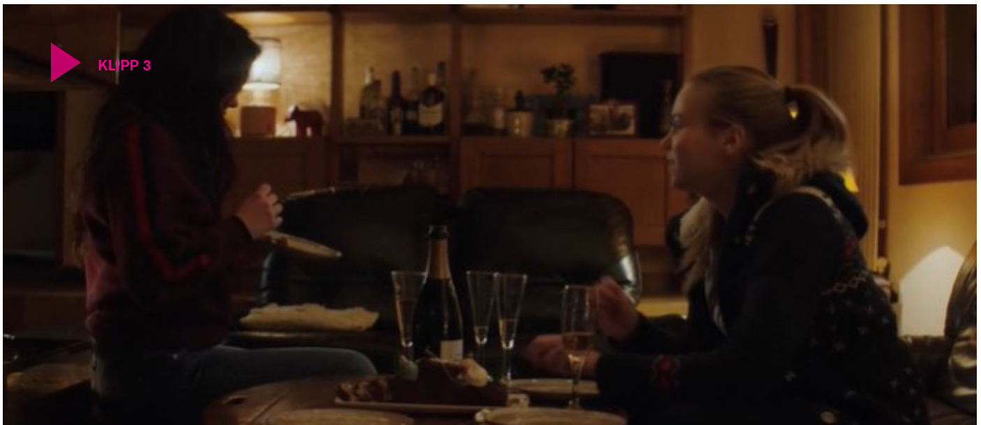
Klipp 3

Lyz? Ofta används ursäkter som att någon är så attraktiv att förövaren inte kan rå för att den går över gränsen, trots att vi alla har ett absolut ansvar för vad vi gör, avsett hur kåta vi är. Men hur blir det för Lyz när Fred säger så? Hos vem hamnar ansvaret för övergreppet och var borde det ligga?