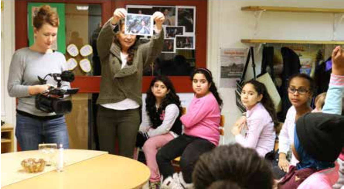
Eleverna på Nytorpsskolan har en filmintroduktion kring Glasblåsarns barn höstterminen 2014.