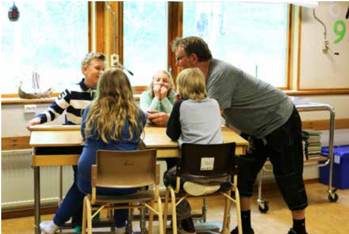
Filmverkstad på Näslundskolan vårterminen 2015.

Flera av de medverkande pedagogerna framhåller i utvärderingen filmpedagogikens ämnesöverskridande potential som en av de främsta styrkorna. Under projektets gång har en del elever exempelvis arbetat med musikvideos, vilket inbegriper idrotts-, musik-, bild- och svenskämnet. Andra har filmat olika moment av friidrotten, vilket inbegriper idrotts-