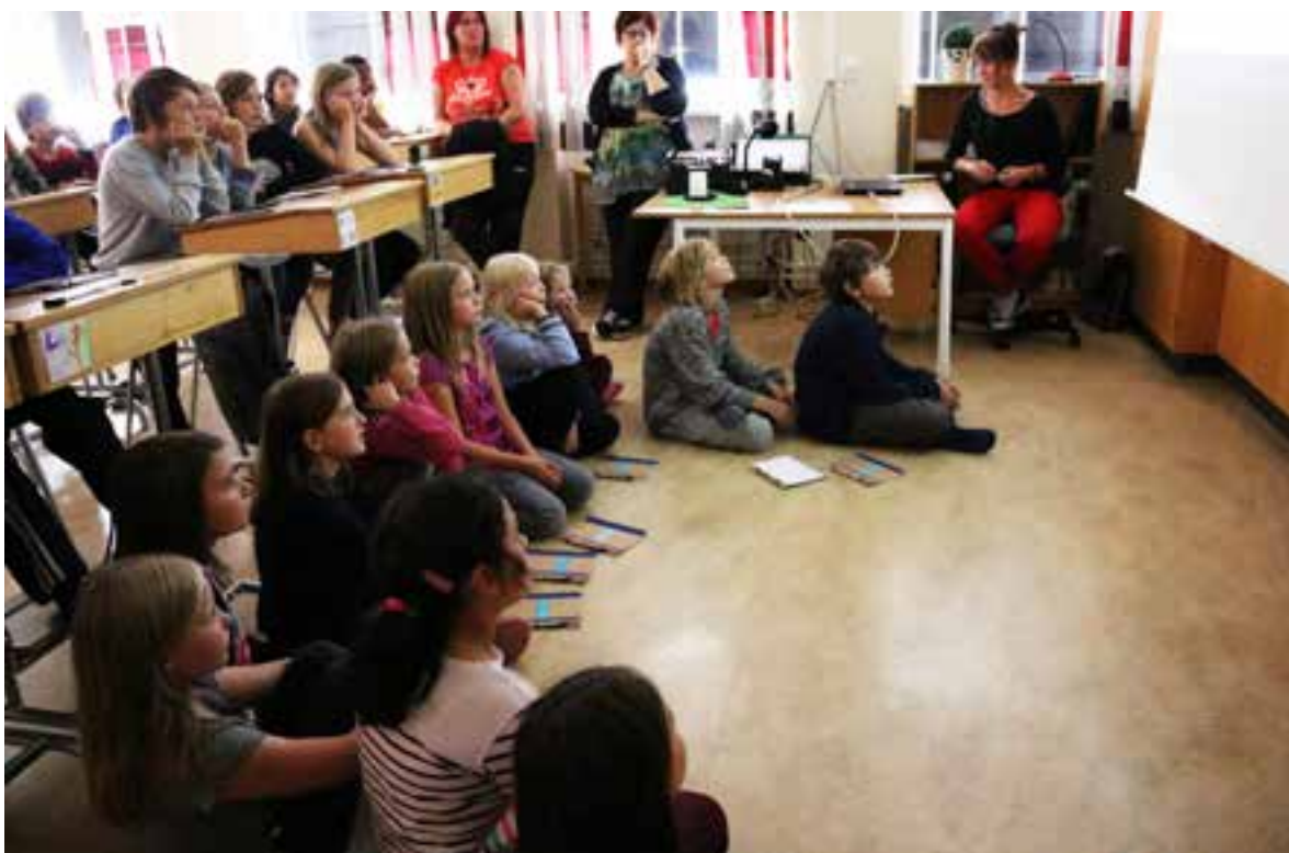
Ringelskolan tittar på Astrid , 2014.