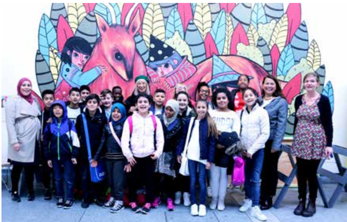
Barnfilmsambassadör Suzanne Osten på besök i Nytorpsskolan höstterminen 2015.