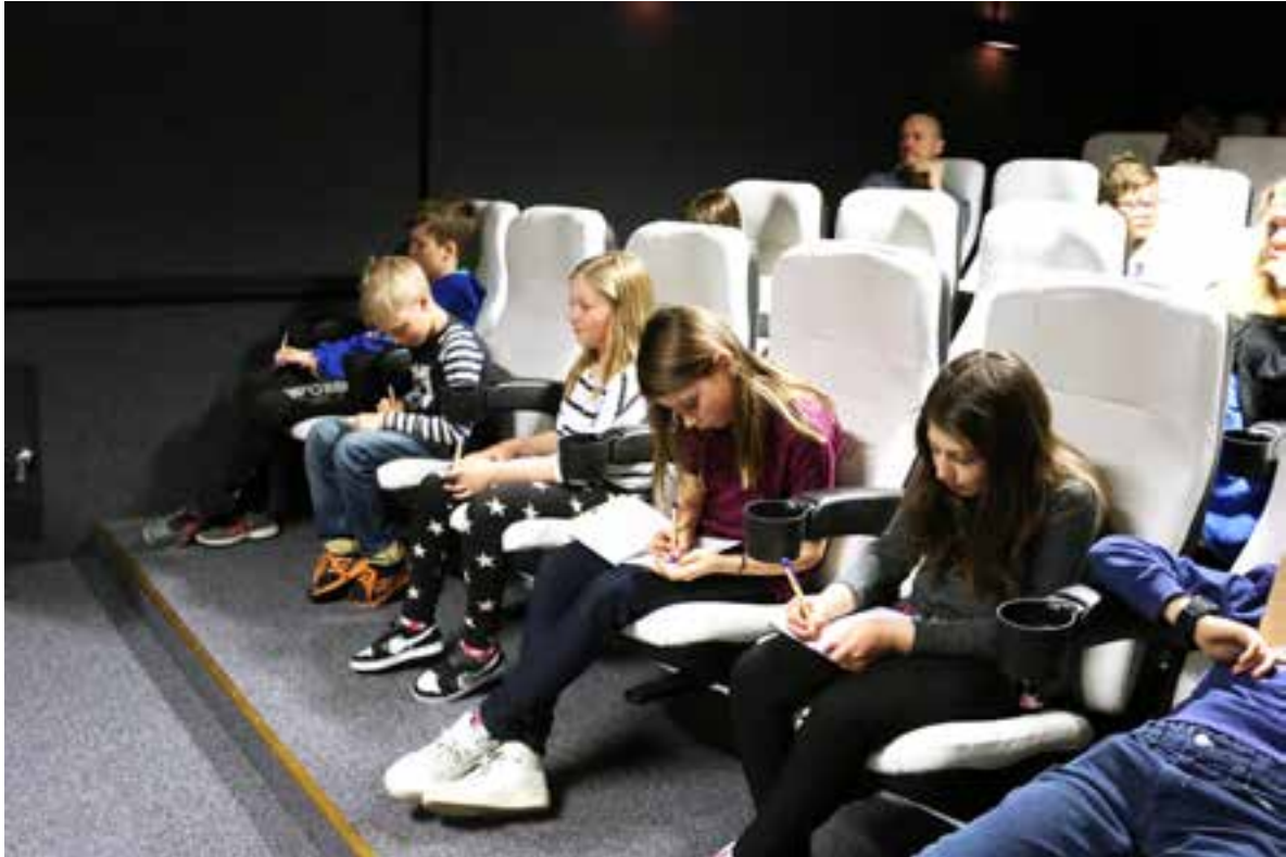
Ringelskolan på studiebesök på Filmpool Nord vårterminen 2015.

En av dessa är filmkunnighet och den innehar en särställning bland de tolv kunnigheterna inom MIK eftersom rörliga bilder i dag utgör grunden även för många av de andra kunnigheterna, såsom tv-, dator-, internet-, spel- och nyhetskunnighet. När vi i dessa sammanhang talar om film är det i den vida definitionen av begreppet, det vill säga rörliga bilder . Enligt detta synsätt innefattar film alltså allt från Ruben Östlunds Guldpalmsbelönade The Square till ett nyhetsinslag på Rapport, en kattvideo på Facebook, en shoppinghaul på Youtube, en sjuårings legoanimation gjord med en app på en surfplatta och säkerhetsinformationsfilmen du ser innan take-off på flygplanet. Filmkunnighet innebär alltså förmågan att aktivt se, förstå, beskriva, tolka, analysera och ifrågasätta rörliga bilder samt en grundläggande förmåga att själv producera olika sorters bilder.