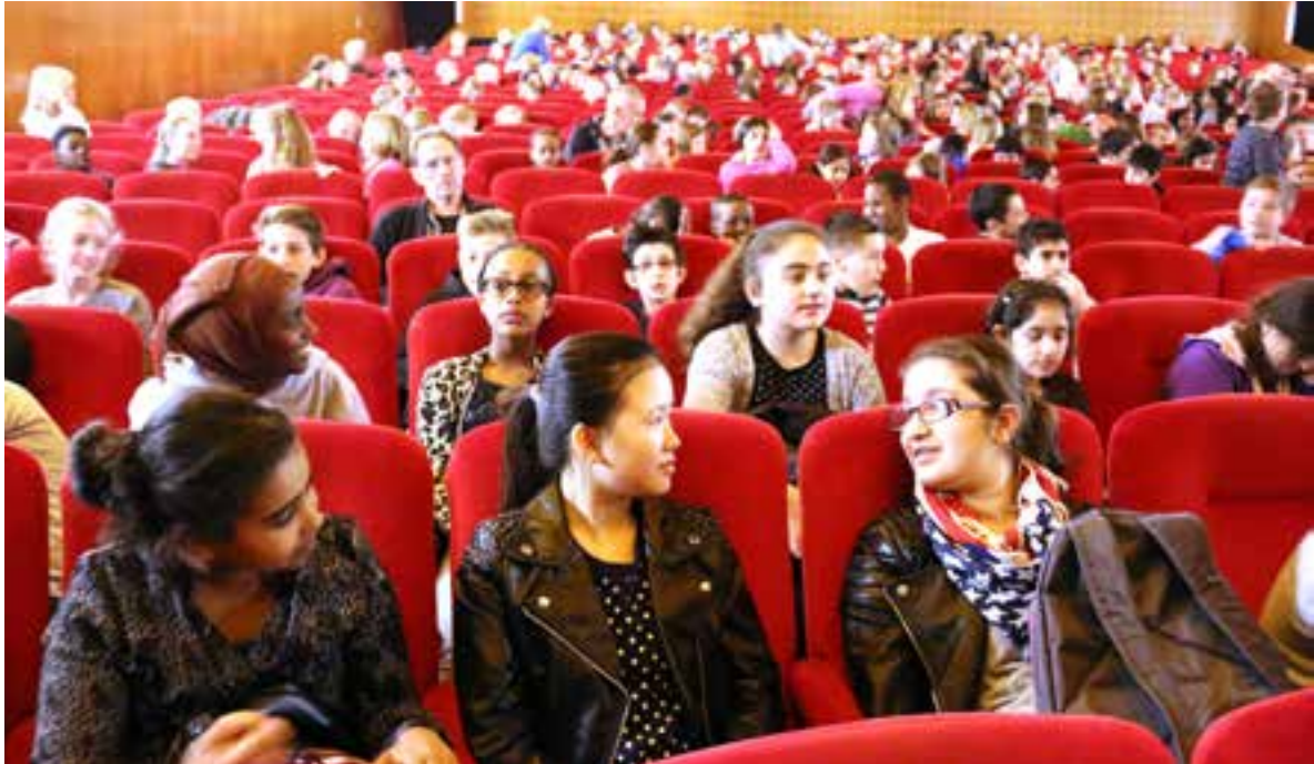
Nytorpsskolan ser Isdraken på biograf Draken i samband med Göteborgs Lilla Filmfestival vårterminen 2015.

Lärarna i kompissskoleprojektet är generellt positivt inställda till traditionell skolbio som aktivitet. De menar att biografupplevelsen ger ett mervärde som är svårt att skapa i ett klassrum eller i en aula. Biografen är – precis som teatern eller museet – en miljö delvis skild från vardagen där elever ges utrymme att känslomässigt och intellektuellt expandera utanför de ofta ganska trånga ramar som gäller i skolmiljön. Flera lärare vittnar om hur elever ”växer” när de befinner sig utanför klassrummet.