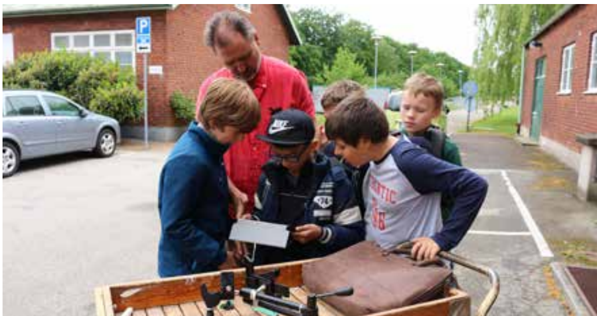
Filmworkshop på Backaskolan vårterminen 2016