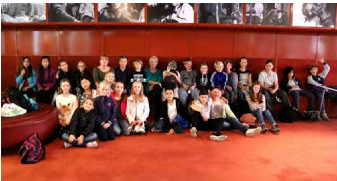
Eleverna i de deltagande skolorna. Uppifrån och ner: Backaskolan, 2014 och Björngårdsskolan, 2015.