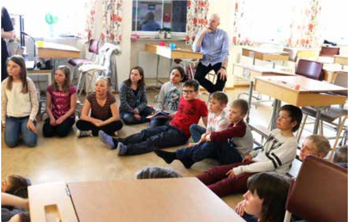
Elever och lärare på Ringelskolan ser Skellig vårterminen 2015.