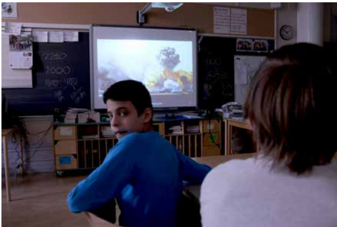
Filmvisning på Björngårdsskolan vårterminen 2016.

och förutsättningar liksom efter den enskilda lärarens motivation och tekniska kunskaper och tillgångar. Filmpedagogiken passar således alla elever och alla pedagoger. Det innebär naturligtvis inte att filmpedagogik kan vara vad som helst eller att allt fungerar lika bra. För trots att det fortfarande är ett tämligen obeforskat ämne finns i Sverige lång erfarenhet och en omfattande kunskap om filmpedagogikens metoder och förtjänster. Vi finner den exempelvis bland lärare, filmpedagoger, kultursamordnare, filmvetare, fritidspedagoger, filmkonsulenter och skolbibliotekarier runtom i landet.