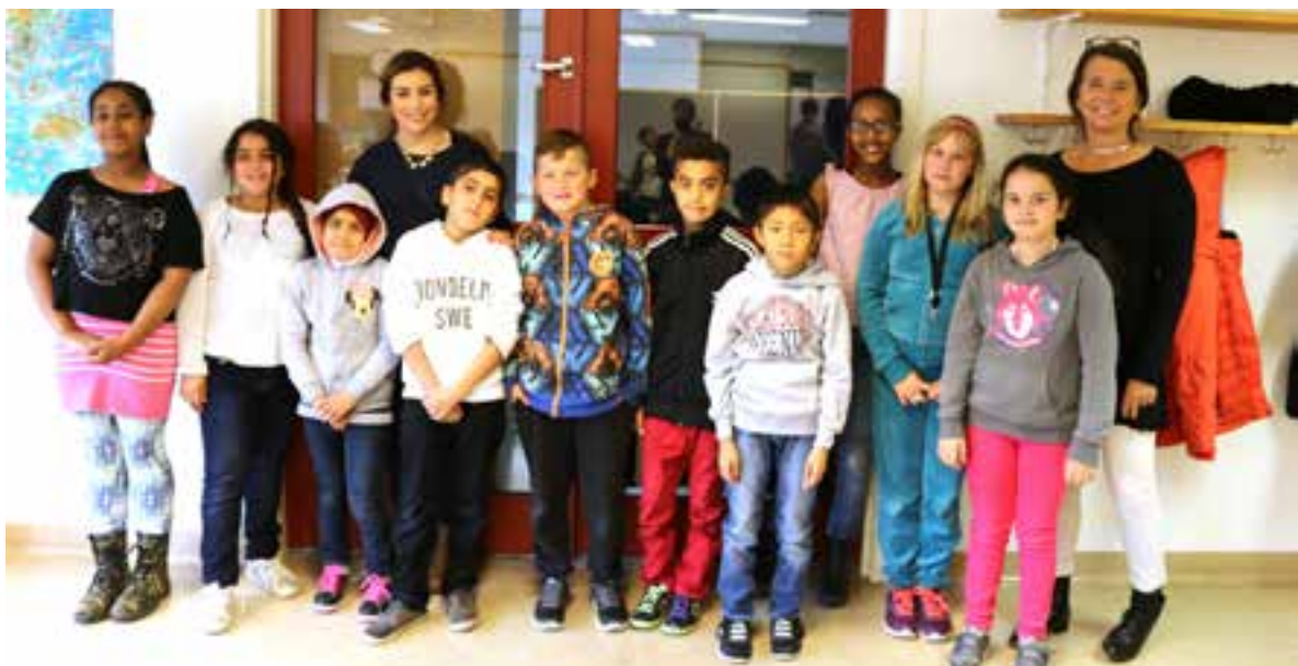
Uppifrån och ner: Ringelskolan, Näslundskolan och Nytorpsskolan, 2014.