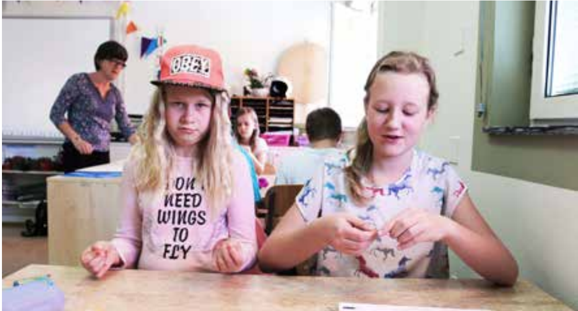
Filmverkstad på Backaskolan vårterminen 2015.

”Eleverna kan i stort sett arbeta helt utan vår hjälp. Fler kan också arbeta samtidigt, vi har arbetat både i helklass och halvklass. (...) Det har gjort att vi kunnat fokusera mer på eleverna och filmens språk.”