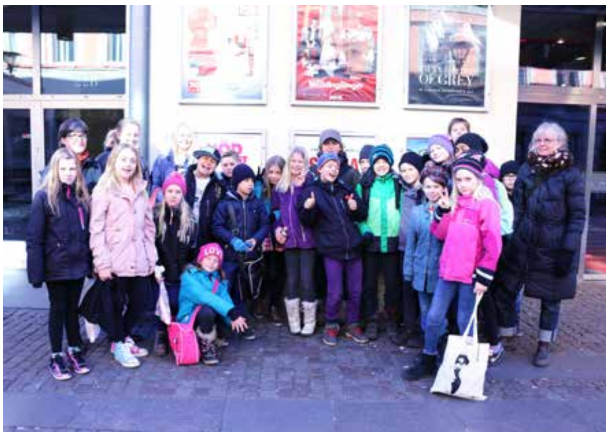
Backaskolan på Life according to Nino i samband med BUFF vårterminen 2015.

Se vidare reportaget "Rapport från klassrummet: Life According to Nino ", klicka här!