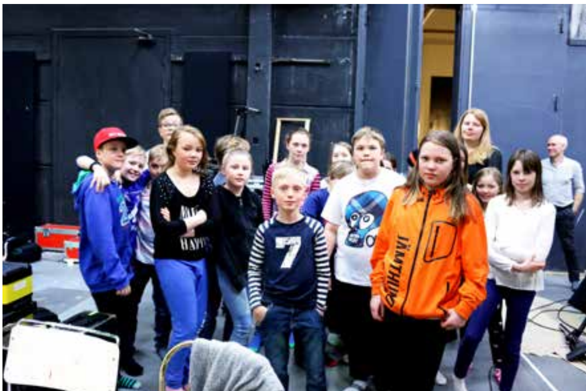
Ringelskolan på studiebesök vid inspelningen av Siv sover vilse vårterminen 2015.