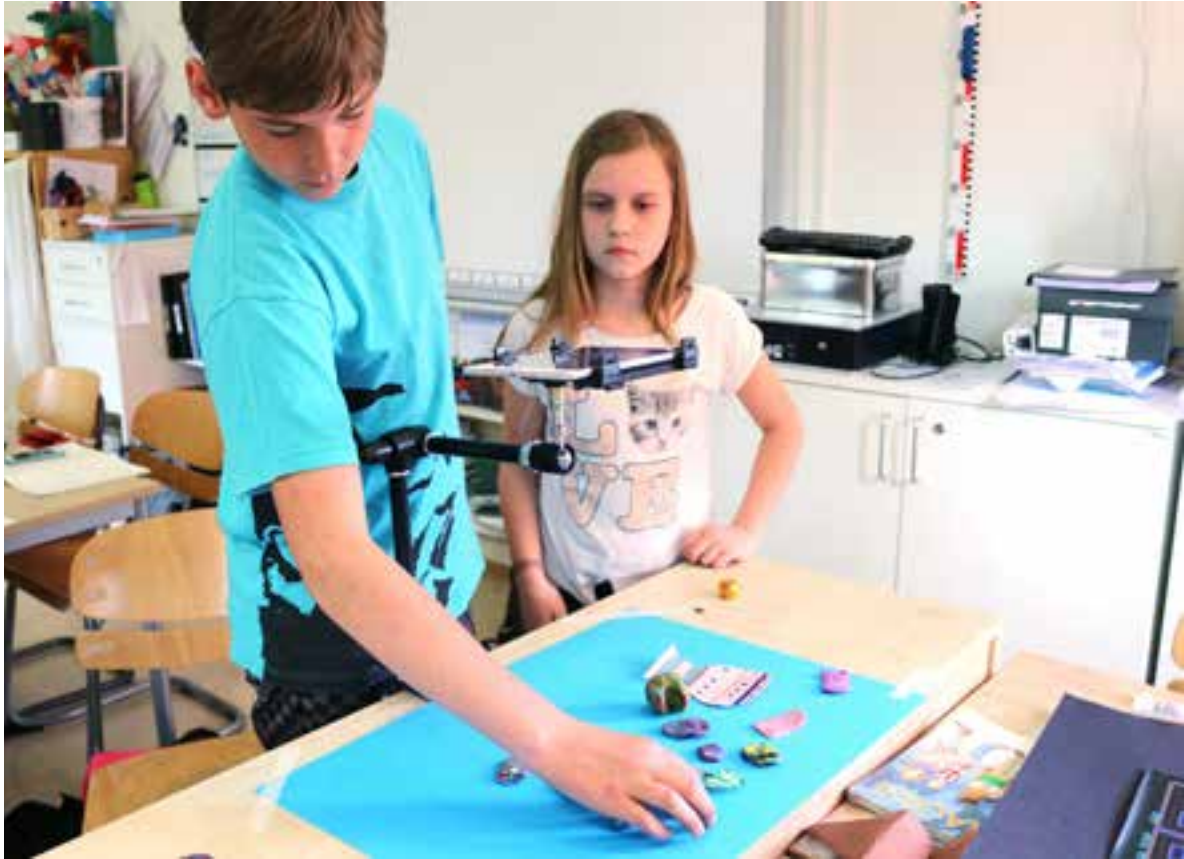
Leranimation på Backaskolan vårterminen 2015.