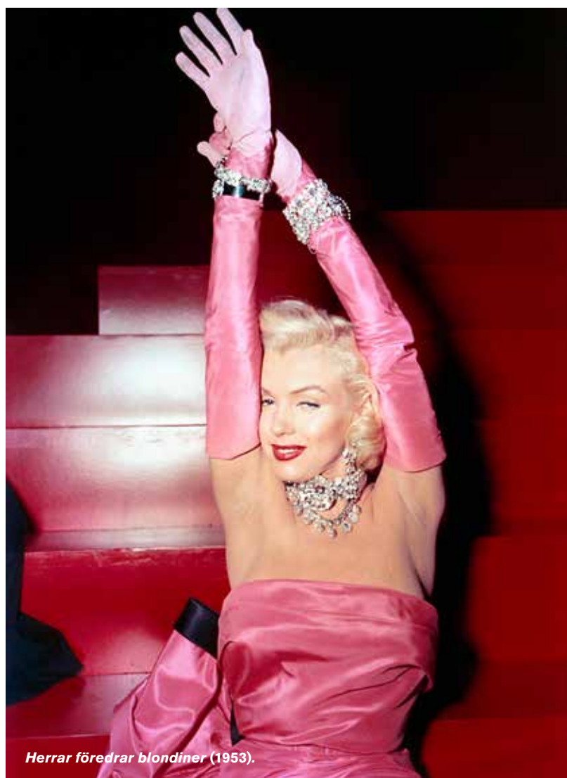
Herrar företrar blondiner (1953).