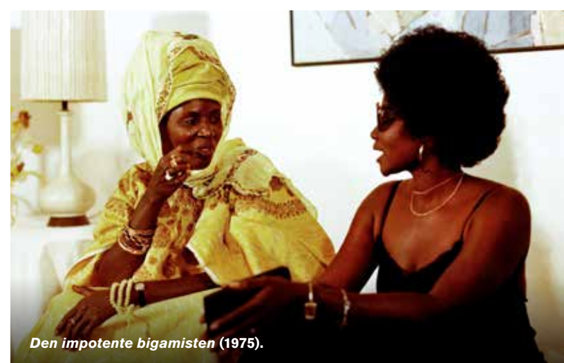
Den impotente bigamisten (1975).