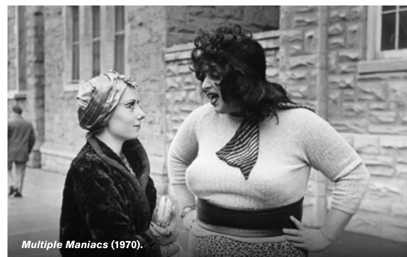
Multiple Maniacs (1970).

Kontakt: cinemateket.se cinemateket@filminstitutet.se 📍 Cinemateket