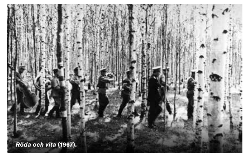
Röda och vita (1967).