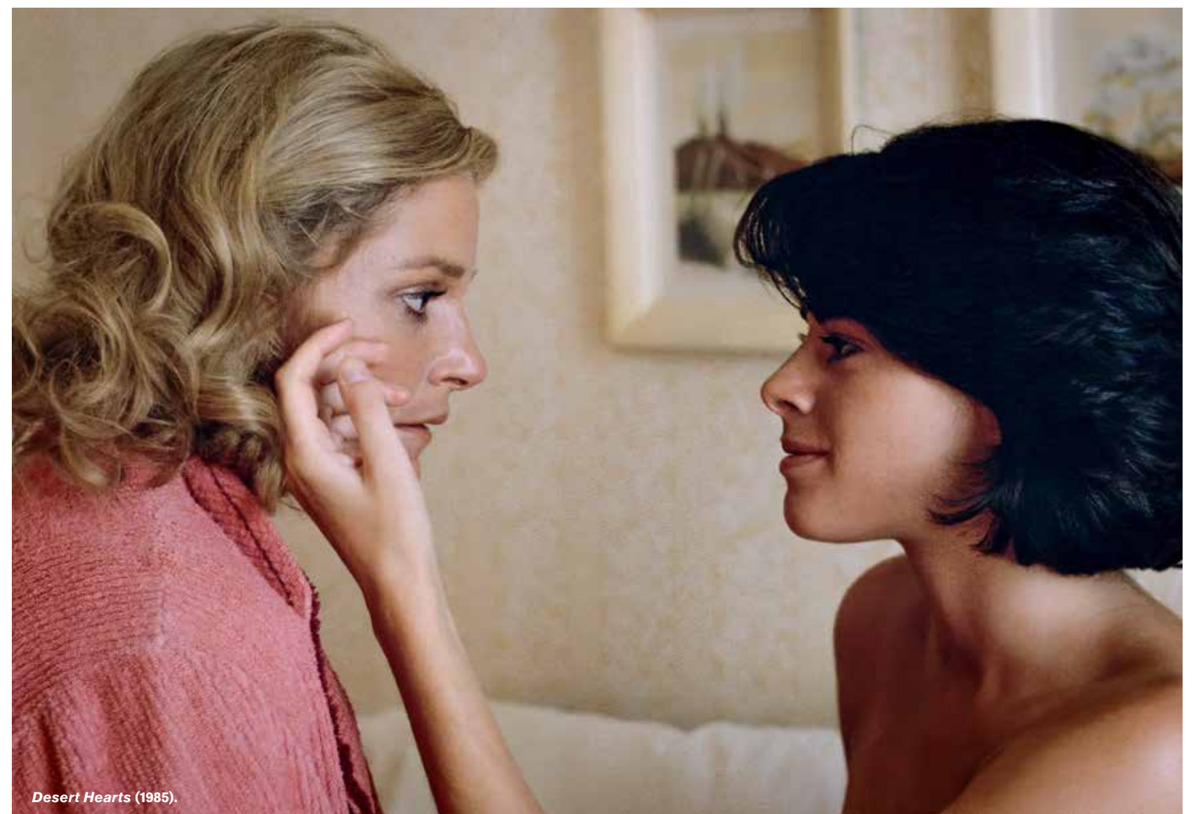
Desert Hearts (1985).

Cinematket är Filminstitutets filmvisningsverksamhet och visar film i Stockholm, Göteborg och Malmö. Cinematkets uppgift är att öka intresset för filmhistorien och för filmen som konstform.