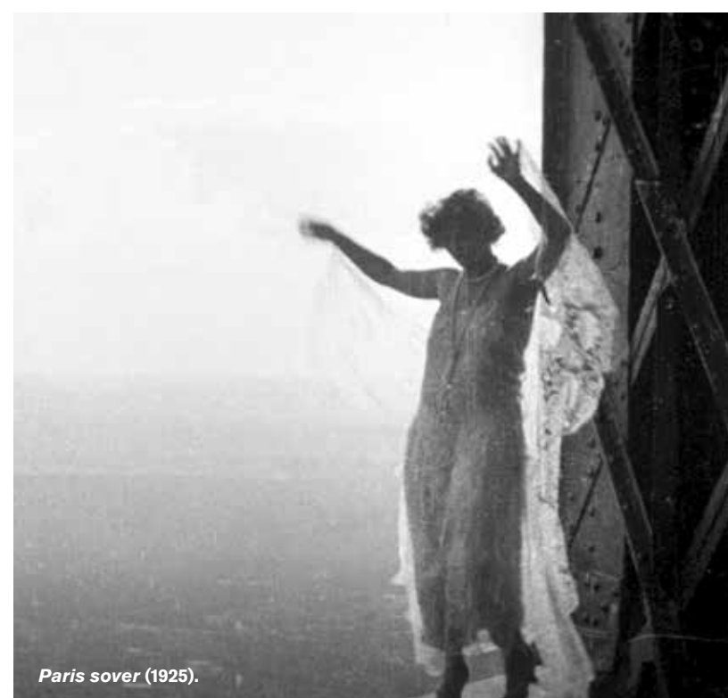
Paris sover (1925).

Barbara Stanwycks juveltyv löses ut mot borgen av sin åklagare (Fred MacMurray) några dagar före jul i romantisk komedi med manus av Preston Sturges.