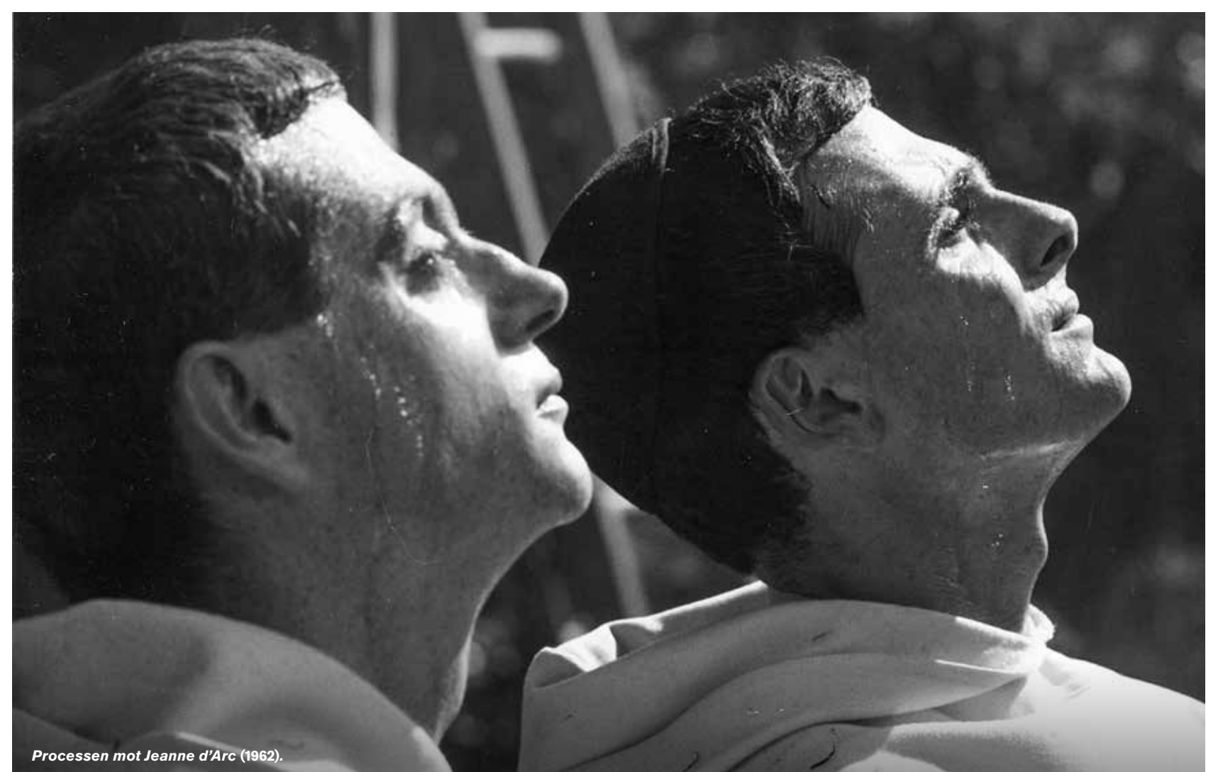
Processen mot Jeanne d'Arc (1962).

s.t. Svensk text e.t. Engelsk text u.t. Utan text